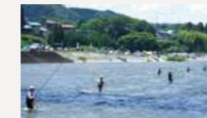
小国川の鮎釣り(舟形町)