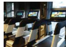
市内スポーツクラブを利用 できます(助成あり)。

各種レクリエーションの企画も多く、 厳しい中でも「楽しい研修医時代」を 送ることができます。