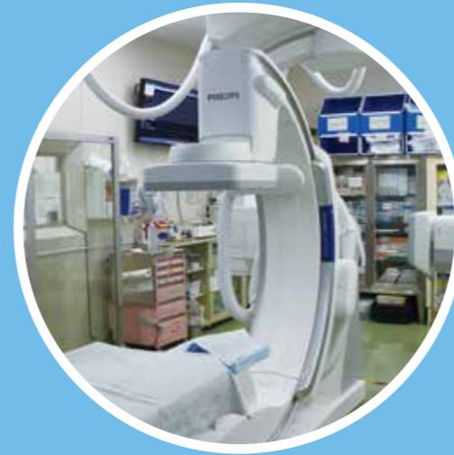
国内でも最新鋭の血管造影装置

1日26.9人、うち救急車搬送6.9人(令和4年度平均)の救急患者を受け入れています。消防本部と連携し、地域メディカルコントロール体制の中心として、救急患者の救命率の向上に努めています。派遣型救急ワークステーションを設置し救急救命士の病院実習を積極的に受け入れています。麻酔科医師等救急スタッフの充実に取り組んでいます。