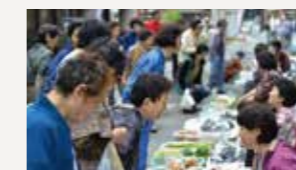
肘折温泉朝市(大蔵村)