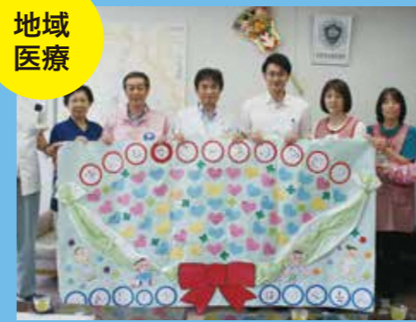
● 県立新庄病院に感謝のメッセージを伝えるセレモニー