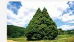
トロの木(小杉の大杉・鮭川村)