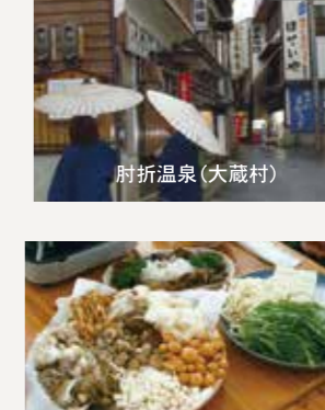
きのこしゃぶしゃぶ