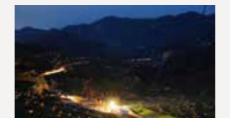
ほたる火コンサート(大蔵村)