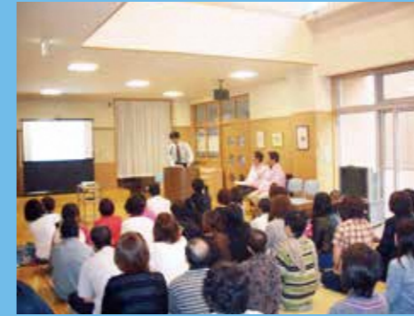
● 学習会「子どもの急病時の対応」