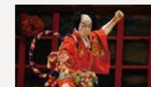
鮭川歌舞伎(鮭川村)