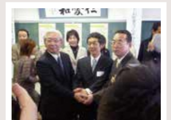
● 私たちお医者さんを守る最上の会発足式

平成23年2月、「私たちお医者さんを守る最上の会」が発足し、当院勤務医の負担軽減を図るための適正受診の呼びかけを行うなどの住民運動を展開しています。当院でも、この会が主催する講演会等に当院医師を派遣するなど、この取組みを支援しています。