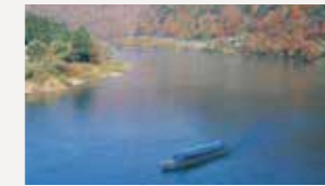
最上川舟下り(戸沢村)