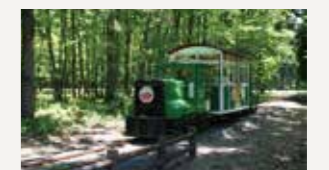
トロッコ列車(真室川町)