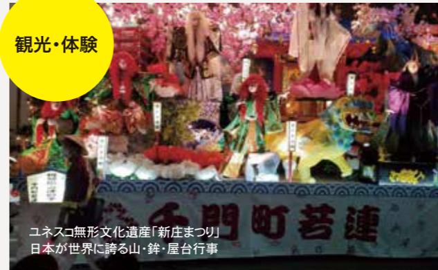
ユネスコ無形文化遺産「新庄まつり」 日本が世界に誇る山・鉾・屋台行事