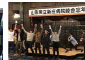
全職種合同の親睦会で、チ ーム医療に必要な交流を深 めています。