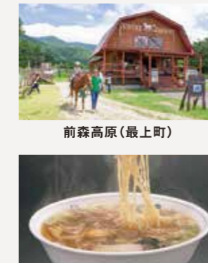
とりもつラーメン