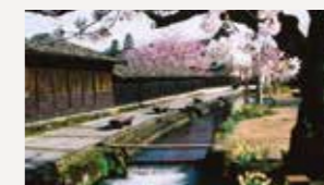
金山の街並み(金山町)