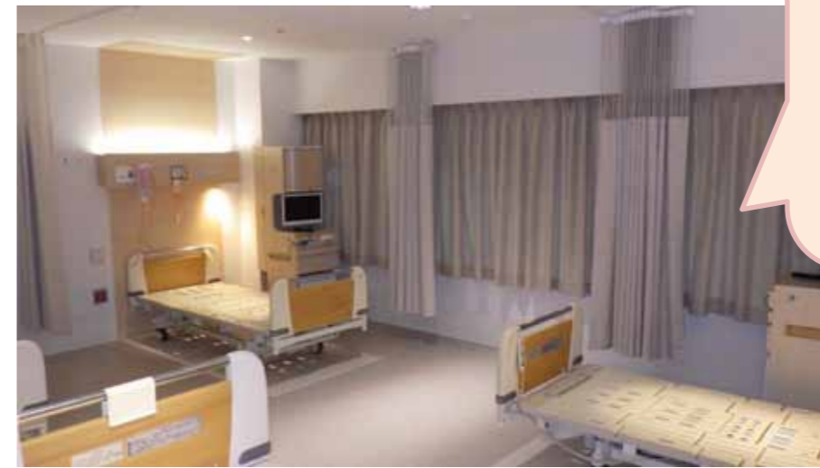
上のモデルルーム写真と実際作られる病室は、検討により変更となる可能性があります。